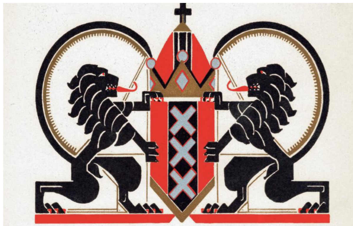
Stadswapen van Amsterdam, 1930. Ontwerp Fré Cohen